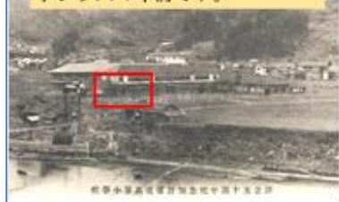
最初の校舎です(1911年) 今から114年前です。