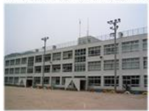
10年前まで使っていた校舎です

150年と一口に言ってもイメージがわからないと思いますので、校舎の写真を見ながらさかのぼってみましょう。これも加計小学校の校舎です。(ええと声が上がる)そうですね。今と違いますね。今の校舎は10年前に新しくなりました。その前に60年間使っていたのがこの校舎です。この校舎でたくさん子どもたちが学びました。