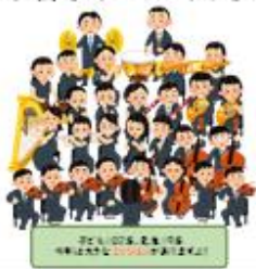
加計小オーケストラ♪

新しい1年が始まりました。春休みはどうでしたか。朝、校門で皆さんが元気に登校してくれてとてもうれしかったです。