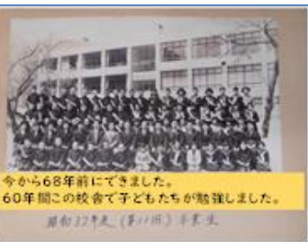
今から68年前にできました。 60年間この校舎で子どもたちが勉強しました。 昭和22年(第11回)卒業生